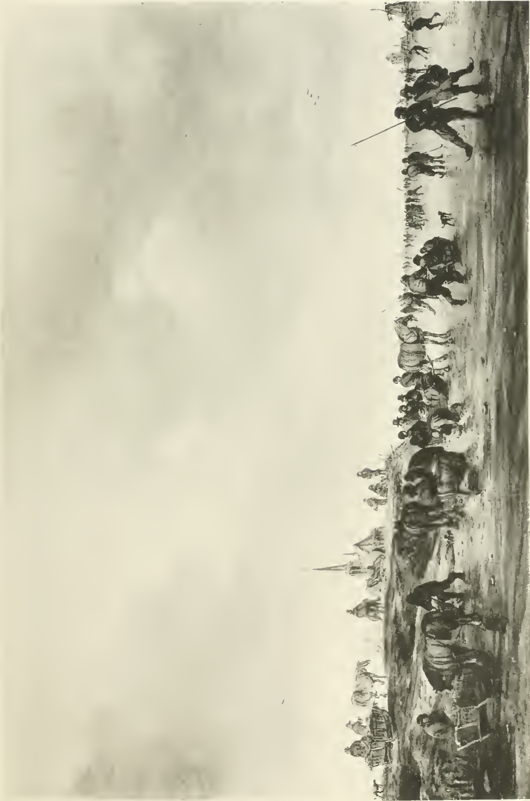
J. VAN GOYEN